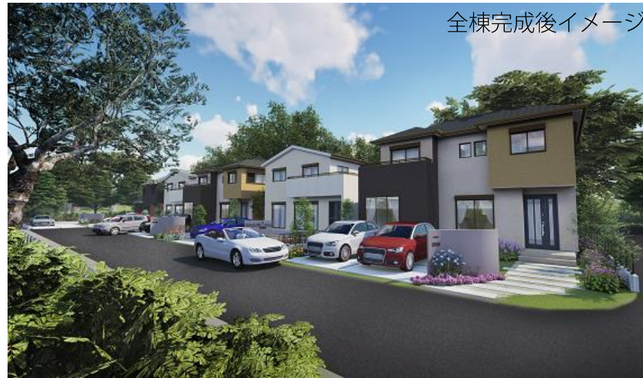
全棟完成後イメージ